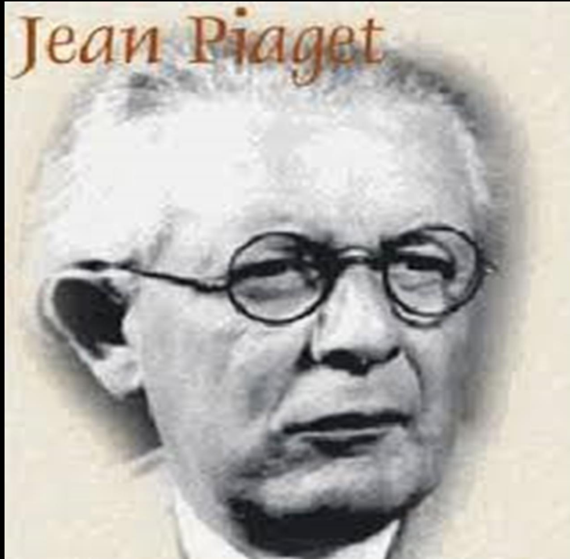
السويسري جان بياجيه (1896 - 1980)