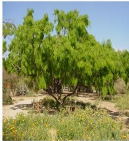
شجرة الغاف Prosopis spp (معدنات الرياح)