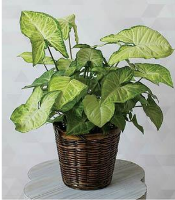
Syngonium vellozianum ج- السنغونيوم