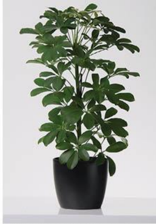
Heptapleurum arborico ب- الشفليرا