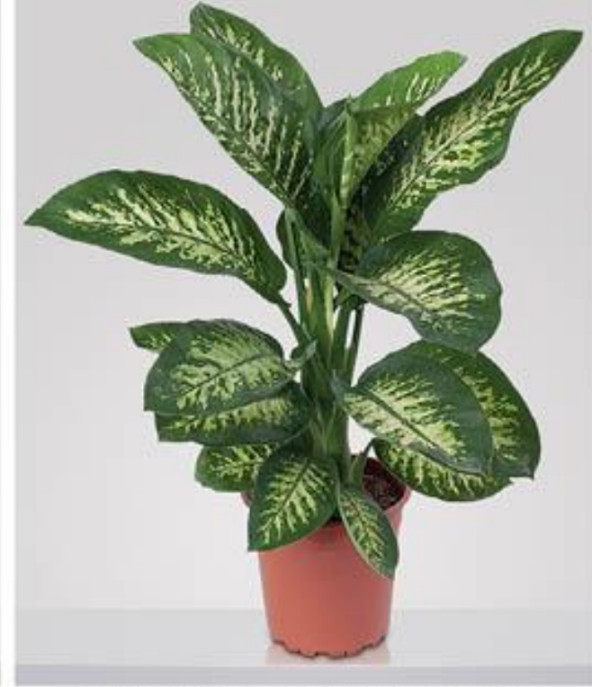
Dieffenbachia tropic أ- الديفنباخيا

الوثيقة ( 09 ) نماذج لنباتات الزينة الداخلية الورقية