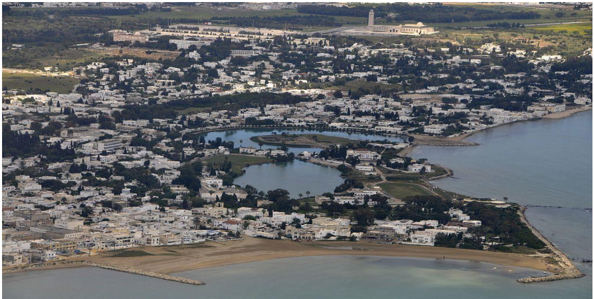
منظر جوي لبحيرات الميناء التجاري و العسكري

تدعمت القوي التجارية بفضل اسطول عسكري قوي يرافق مختلف الرحلات التجارية و يؤمن المسالك التجارية كما تم استغلال الاسطول العسكري في عملية توسيع المجال الجغرافي.