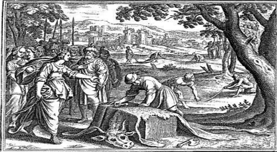
Dido Purches Land for the Foundation of Carthage. Engraving by Matthäus Merian the Elder, in Historische Chronica , Frankfurt a.M., 1630. Dido's people cut the hide of an ox into thin strips and try to enclose a maximal domain.

حرر بيليزار قرطاج من هيمنة الوندال عام 534 م وعرفت المدينة مرة أخرى رفاهة حقيقية ونهضة جديدة.