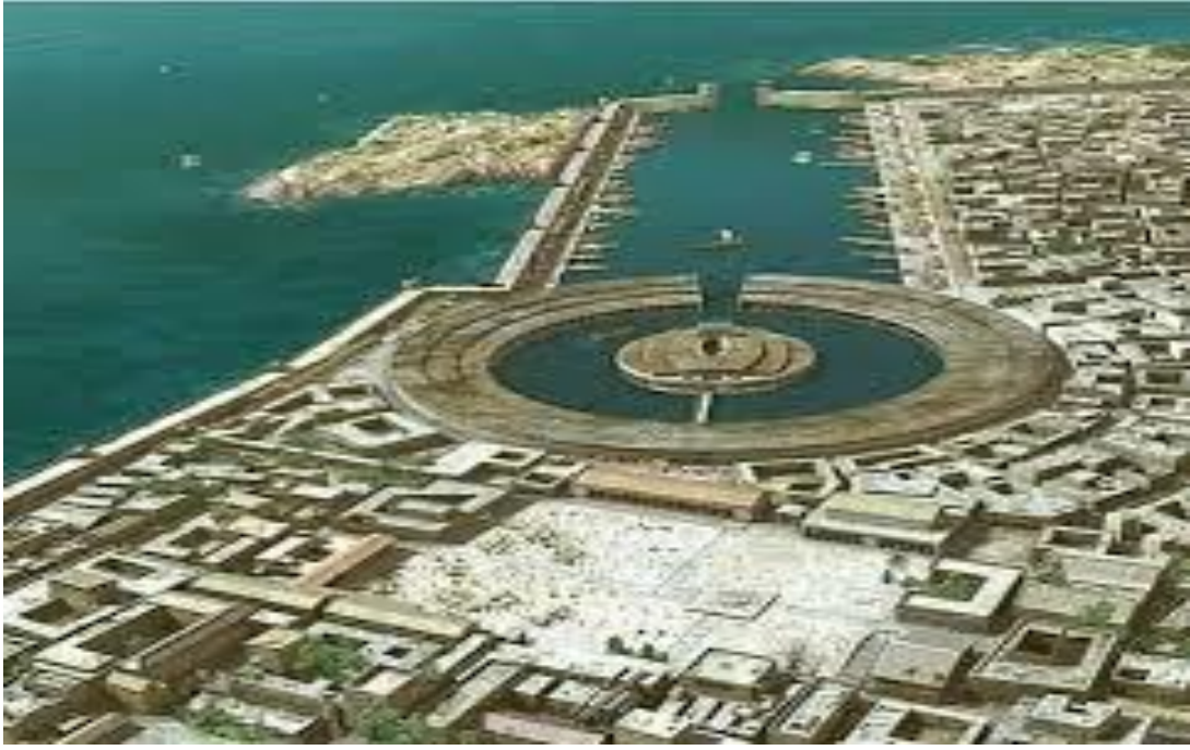
صورة لميناء قرطاج التجاري و العسكري