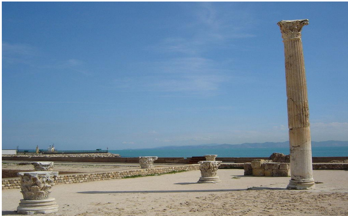
آثار قرطاجية ( عن الأنترنت )