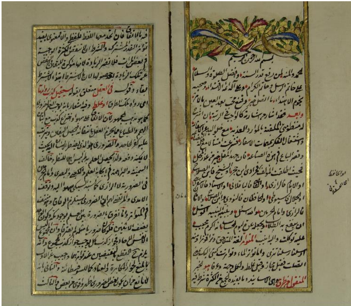
اللوحة الأولى من نسخة مكتبة الملك عبد العزيز الأولى (أ)