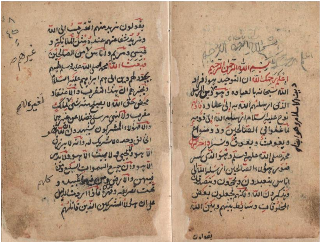
اللوحة الأولى من نسخة دار الملك عبد العزيز - مجموعة آل عبد اللطيف - "ج"