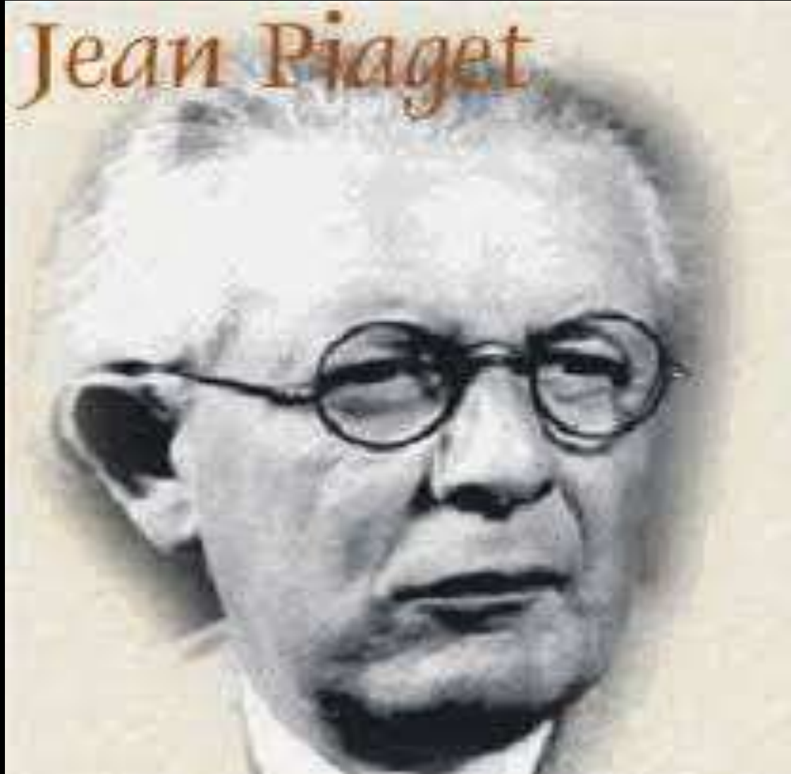
السويسري جان بياجيه (1896 - 1980)